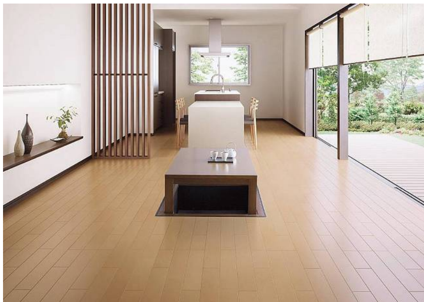
※イメージ写真のため実際とは異なる場合がございます。