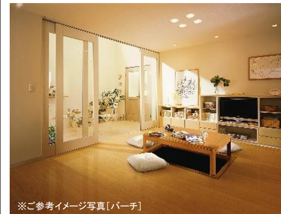
※ご参考イメージ写真【パーチ】