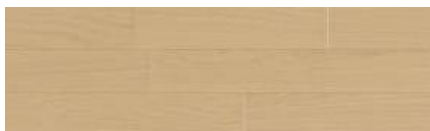
エクセルライト色