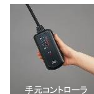
手元コントローラ