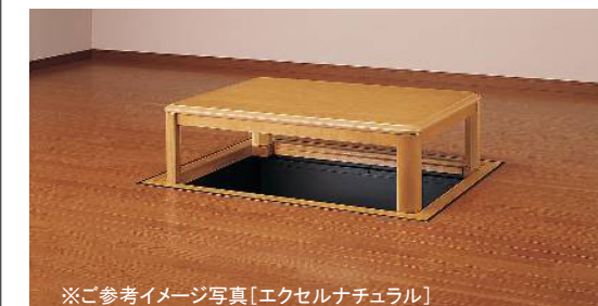
※ご参考イメージ写真【エクセルナチュラル】