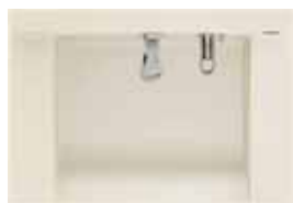
ストーンホワイト