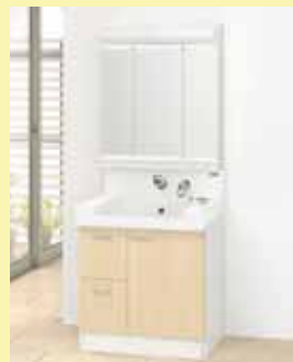
カームジェラータ