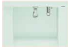
ストーングリーン