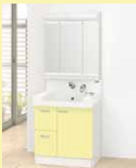
フラッシュレモン