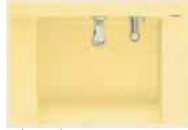
ストーンイエロー